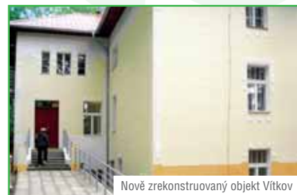
Nově zrekonstruovaný objekt Vítkov

V září 2007 jsme po citlivé modernizaci otevřeli pro naše hosty ubytování v prvním a druhém patře pavilonu Vítkov. Čtyři dvoulůžkové a osm jednolůžkových pokojů, všechny s vlastním příslušenstvím a TV vás příjemně překvapí. V přízemí najdete rehabilitační pracoviště pro lázeňské klienty.