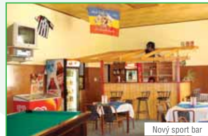
Nový sport bar

Pro sportovní fanoušky a nadšence, ale nejen pro ně, jsme otevřeli v pavilonu Praděd odpolední a večerní SPORTBAR. Vy, kteří si chcete vychutnat přímé přenosy utkání v jedinečné atmosféře nebo si zahrát kulečnic, šipky, stolní fotbal, neváhejte proto nově otevřený SPORTBAR navštívit.