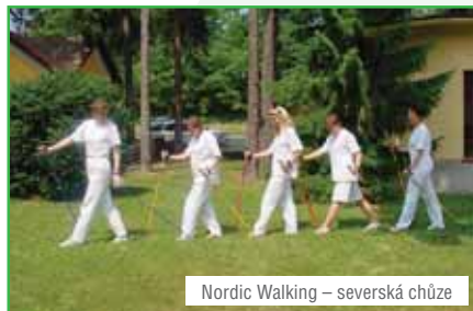
Nordic Walking – severská chůze

Jedná se o inovativní slupovací masku pro intenzivní kúru proti celulitidě s nádhernou vůní vanilky a skořice.