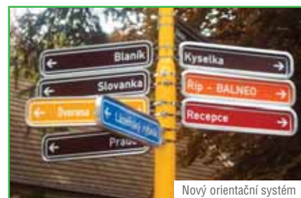
Nový orientační systém

Aby se všichni hosté v lázních cítili brzy jako doma a nemuseli cíl své cesty v areálu lázní hledat, nový orientační systém vás bezpečně dovede na dané místo, do ubytovacího pavilonu, na procedury, do jídelny, restaurace, pivnice, SPORTBARU či k jezírkům v parku, nedalekým rybníčkům nebo koupališti.